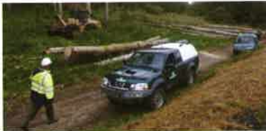
Tracteur forestier et véhicules de service

Toutefois, les véhicules utilisés pour les secours (pompiers, police) ou à des fins professionnelles liées à la protection et à la gestion des espaces naturels (tracteurs, véhicules de service ONF, exploitants agricoles ou forestiers...) ne sont pas concernés par les interdictions.